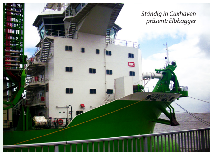
Ständig in Cuxhaven präsent: Elbbagger

Mit Angabe des 29.10.2021 hat die Wasser- und Schifffahrtsverwaltung (WSV) eine neue Auswirkungsprognose für die Sedimentverbringung am Neuen Lüchtergrund veröffentlicht, mit 5 Jahren Gültigkeit. Darin wird von einer deutlichen Erhöhung der Verklappung von Feinsedimenten vor Cuxhaven ausgegangen, dennoch wird alles für den Gesamttraum Elbmündung und innere Deutsche Bucht als unbedenklich nach Wasser-Rahmenrichtlinie und nur mit geringen Auswirkungen auf die Natur (Wattenmeer, Fische, Vögel usw.) angesehen. Hat sich da Hamburg selber einen Freibrief erteilt? Schon vor Veröffentlichung der Prognose wurde der Anteil an Hafen-Sedimenten mit höheren Schadstoffklassen an der Klappstelle Neuer Lüchtergrund deutlich erhöht. Umweltverbände hatten sogar eine Anzeige oder Klage geprüft, diese zunächst bis zur neuen Auswirkungsprognose zurückgestellt. Eine Bewertung wird in den nächsten Monaten erfolgen. Vom