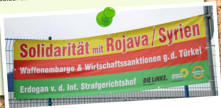
Die Türkei greift an

Seit 2018 erklären sich immer mehr Städte und Gemeinden zu sicheren Häfen – mittlerweile sind es 100 – und fordern damit einen menschenwürdigen Umgang mit Geflüchteten. Rottenburg hatte sich im Januar der Initiative „Seebrücke“ angeschlossen und damit genauso wie die anderen Städte öffentlich und mit Nachdruck ihre Bereitschaft bekundet, aus Seenot gerettete Menschen zusätzlich aufzunehmen.“ 8.10.19, Schwarzwälder Bote